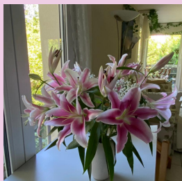
Mon bouquet de Lys l'appartement entiers et parfumé